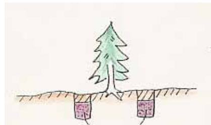
ボカシで作った堆肥